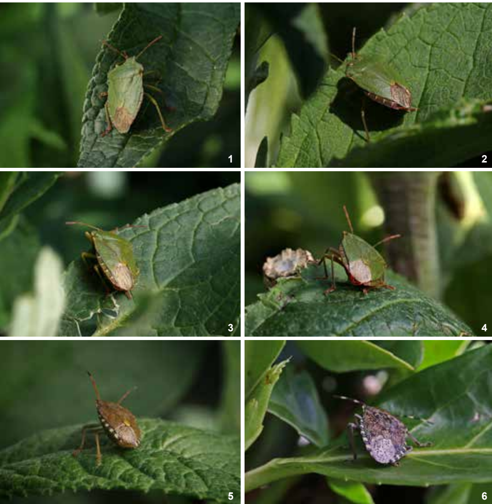
1 à 4 : la Punaise verte Palomena prasina . 5 : Holcostethus vernalis . 6 : la Punaise nébuleuse Rhaphigaster nebulosa