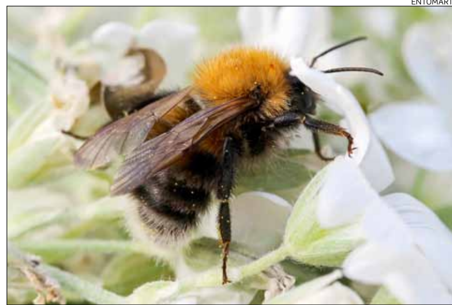
Kartanokimalainen on sopeutunut ihmisen muokkaamiin kulttuuriympäristöihin, kuten puistoihin ja puutarhoihin.