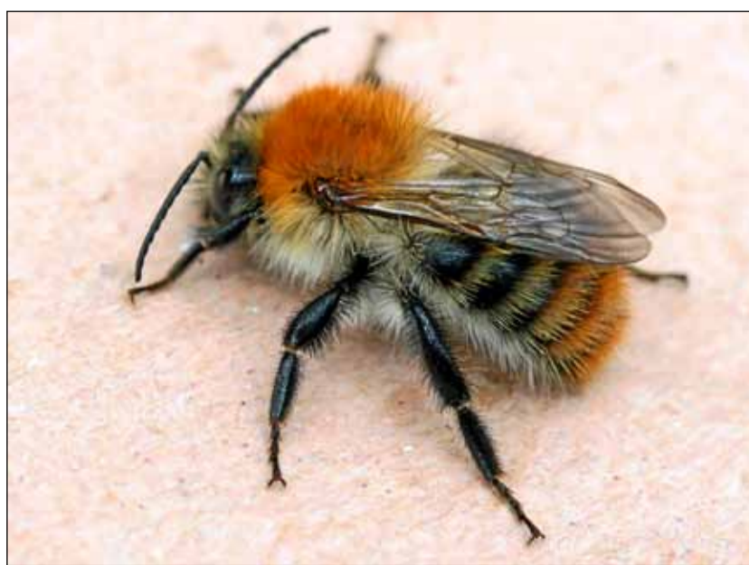
Peltokimalainen on niin keskittynyt kukan meteen, ettei se pistä tarkkailijaansa, ellei pörräiseen tartu sormin.